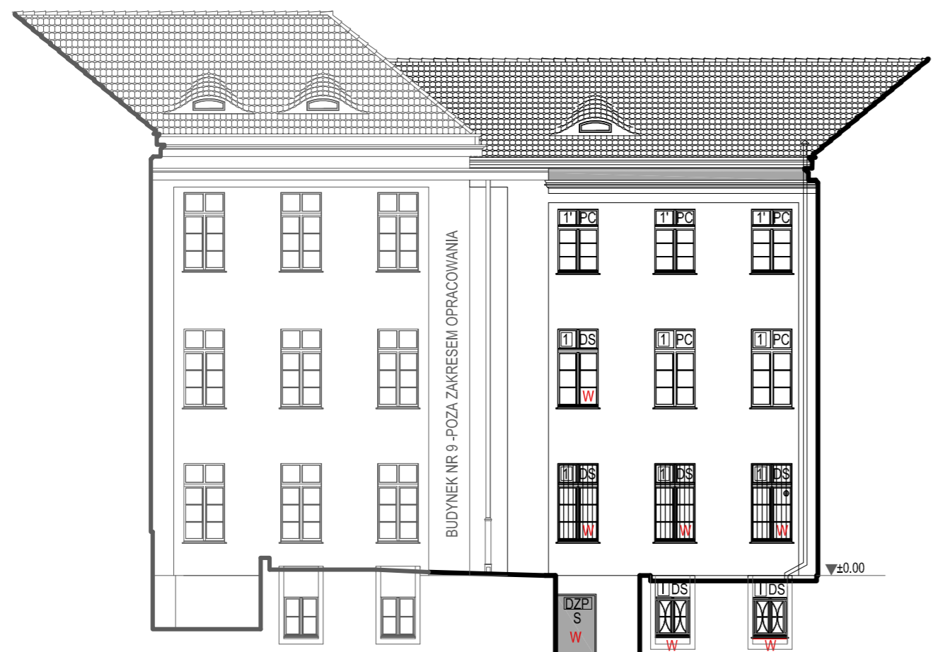
3 - ELEWACJA PÓŁNOCNA GALERII

OZNACZENIA TYPÓW STOLARKI PRZYJĘTE W INWENTARYZACJI PC - OKNA PCV WYKONANE Z ZACHOWANIEM GŁÓWNYCH PODZIAŁÓW DN - NOWA STOLARKA DREWNIANA DS - OKNA SKRZYNKOWE O ZRÓŻNICOWANYM STANIE TECHNICZNYM S - DRZWI STALOWE W - ELEMENTY STOLARKI ZAKWALIFIKOWANE DO WYMIANY R - ELEMENTY STOLARKI ZAKWALIFIKOWANE DO REMONTU