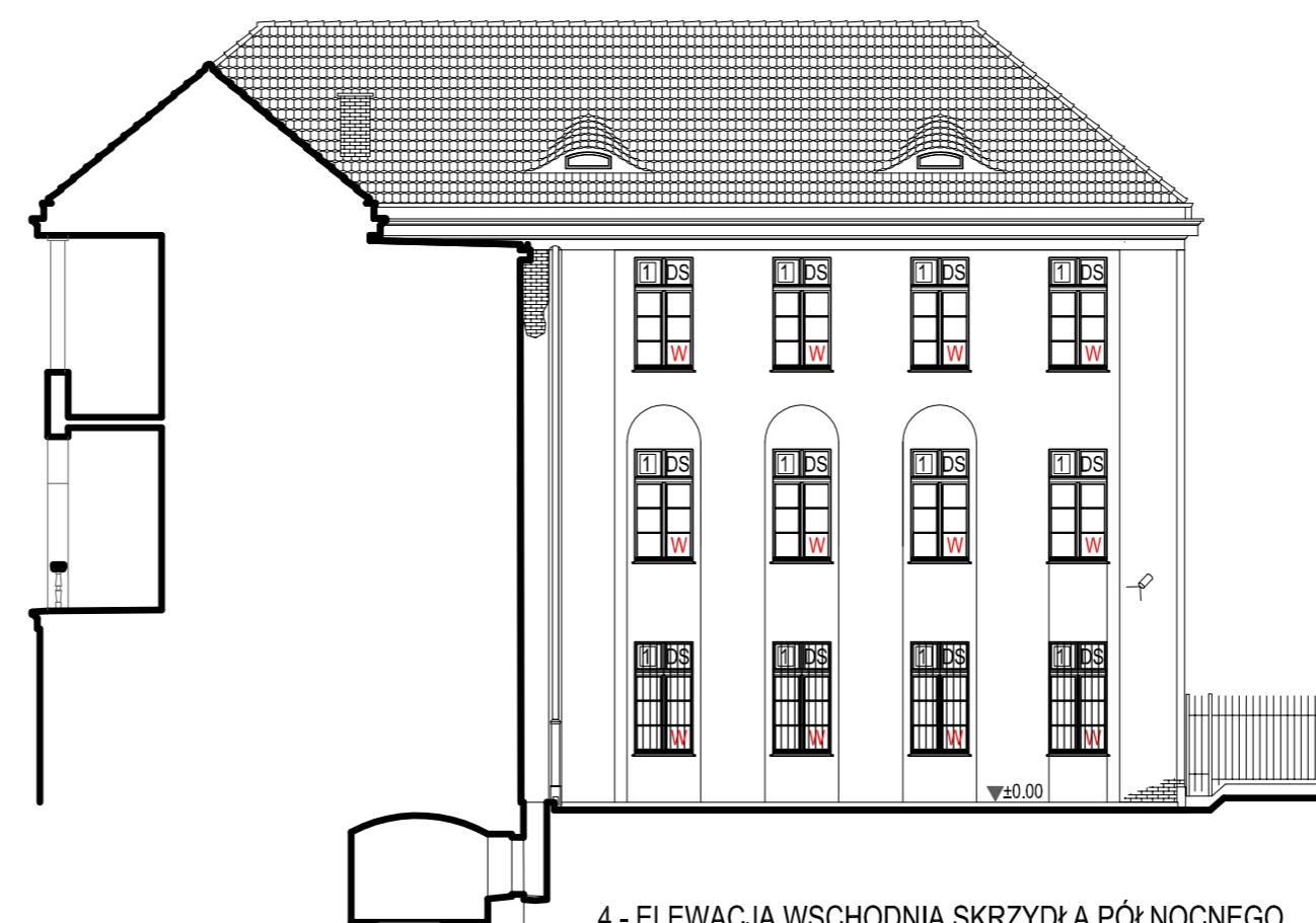
4 - ELEWACJA WSCHODNIA SKRZYDŁA PÓŁNOCNEGO