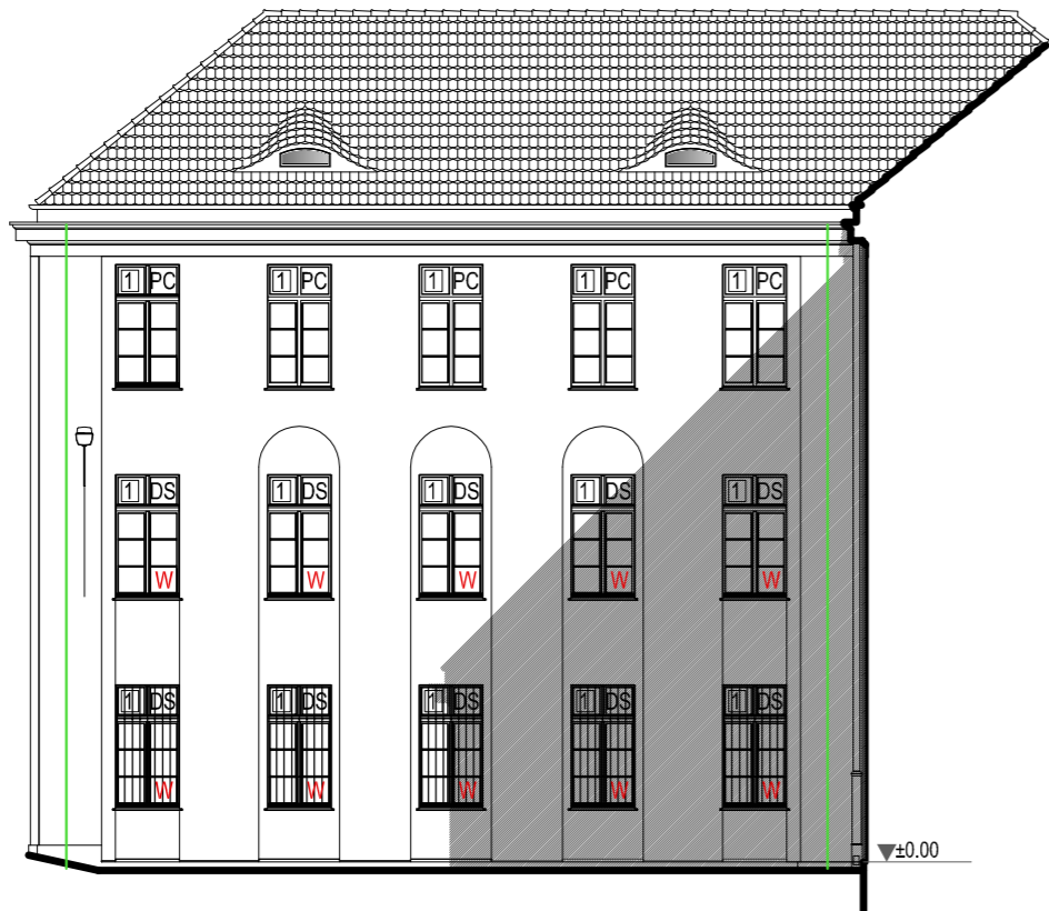
2 - ELEWACJA ZACHODNIA SKRZYDŁA PÓŁNOCNEGO