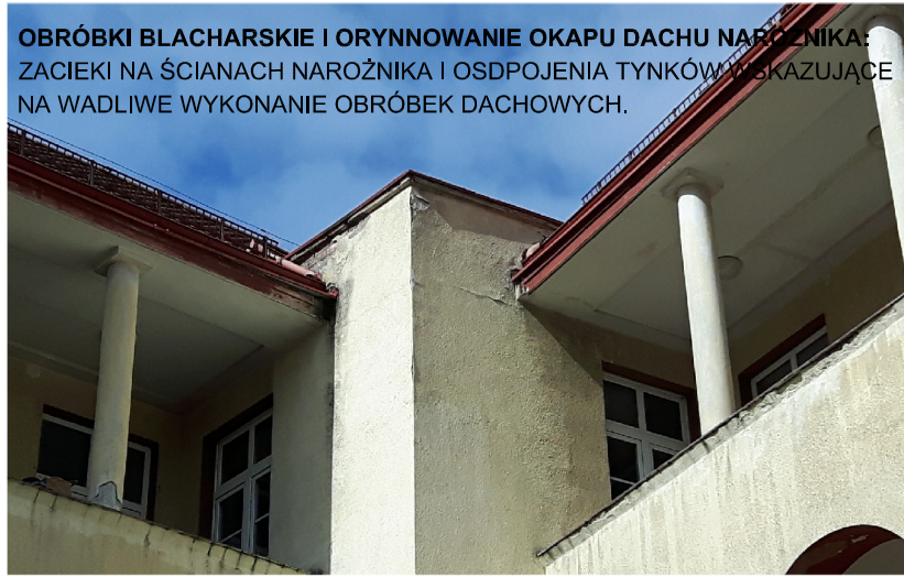
OBROBKI BLACHARSKIE I ORYNNOWANIE OKAPU DACHU NAROZNIKA: ZACIEKI NA ŚCIANACH NAROZNIKA I OSDPOJENIA TYNKÓW WSKAZUJĄCE NA WADLIWE WYKONANIE OBROBEK DACHOWYCH.