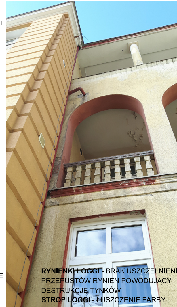
RYNIENKI LOGGI - BRAK USZCZELNIENIA PRZEPUSTÓW RYNIEN POWODUJĄCY DESTRUKCJĘ TYNKÓW STROP LOGGI - ŁUSZCZENIE FARB