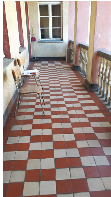
POSADZKI CERAMICZNE - ŚREDNI STAN