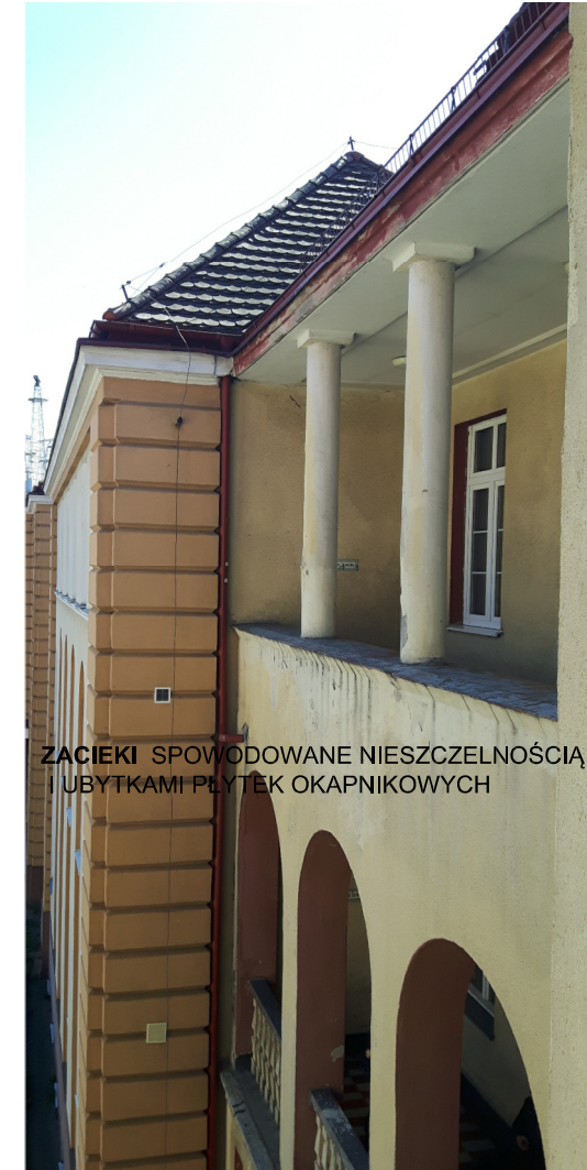
ZACIEKI SPOWODOWANE NIESZCZELNOŚCIĄ I UBYTKAMI PŁYTEK OKAPNIKOWYCH