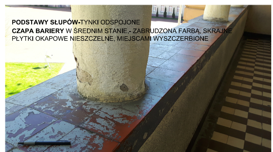
PODSTAWY SŁUPÓW-TYNKI ODSPÓJONE CZAPA BARIERY W ŚREDNIM STANIE, - ZABRUDZONA FARBA, SKRAJNE PŁYTKI OKAPOWE NIESZCZELNE, MIEJSCAMI WYSZCZERBIONE