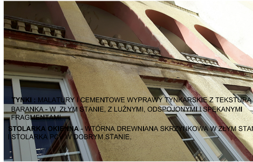
TYNKI: MALATURY I CEMENTOWE WYPRAWY TYNKARSKIE Z TEKSTURĄ BARANKA - W ZŁYM STANIE, Z LUŻNYMI, ODSPÓJONYMI I SPEKANYMI FRAGMENTAMI STOLARKA OKIENNA - WITÓRNA DREWNIANA SKRZYNKOWA W ZŁYM STANIE I STOLARKA PCW W DOBRYM STANIE.