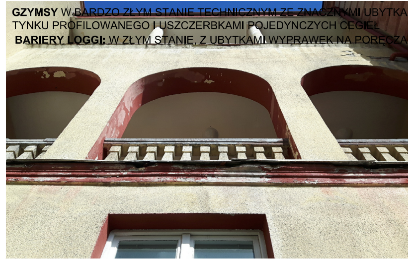
GZYMSY W BARDZO ZŁYM STANIE TECHNICZNYM ZE ZNACZNYMI UBYTKAMI TYNKU PROFILOWANEGO I USZCZERBKAMI POJEDYNCZYCH CEGIEŁ BARIERY LOGGI: W ZŁYM STANIE, Z UBYTKAMI WYPRAWEK NA PORĘCZACH