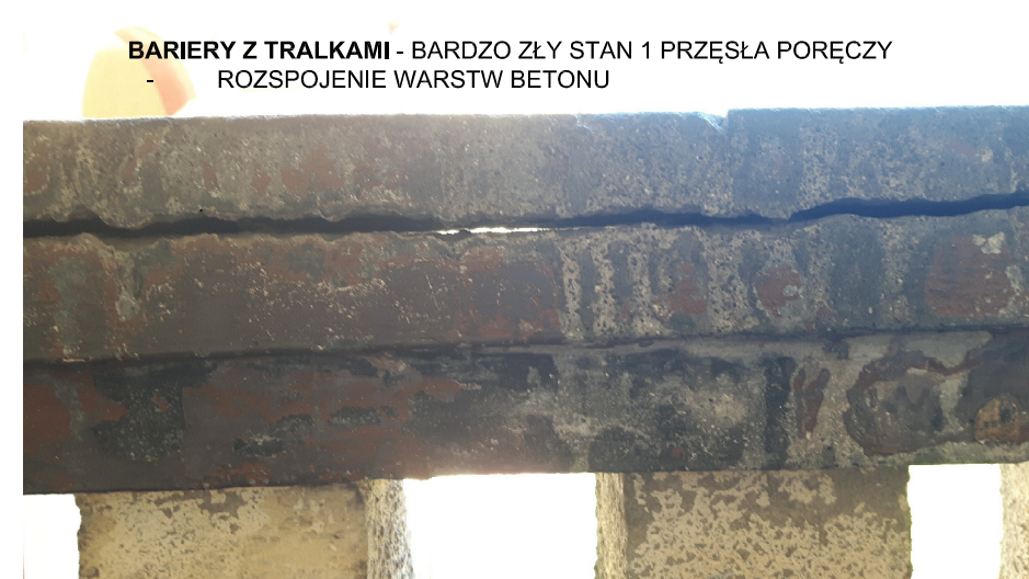
BARIERY Z TRALKAMI - BARDZO ZŁY STAN I PRZĘŚLA PORĘCZY - ROZSPOJENIE WARSTW BETONU