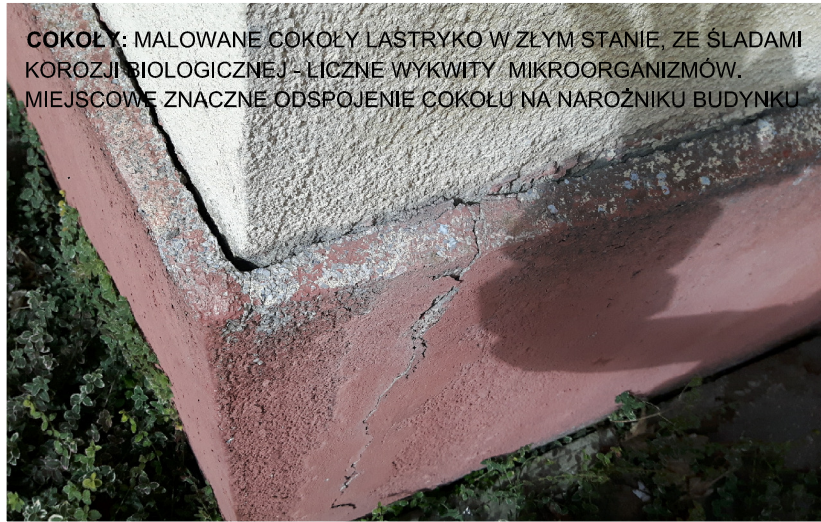
COKOLY: MALOWANE COKOLY ŁASTRYKO W ZŁYM STANIE, ZE ŚLADAMI KORYZJI BIOLOGICZNEJ - LICZNE WYKWITY MIKROORGANIZMÓW. MIEJSCOWE ZNACZNE ODSPÓJENIE COKOŁU NA NAROŻNIKU BUDYNKU