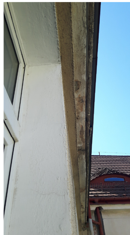
WYSZCZERBIONE KAPINOSY GZYMSÓW